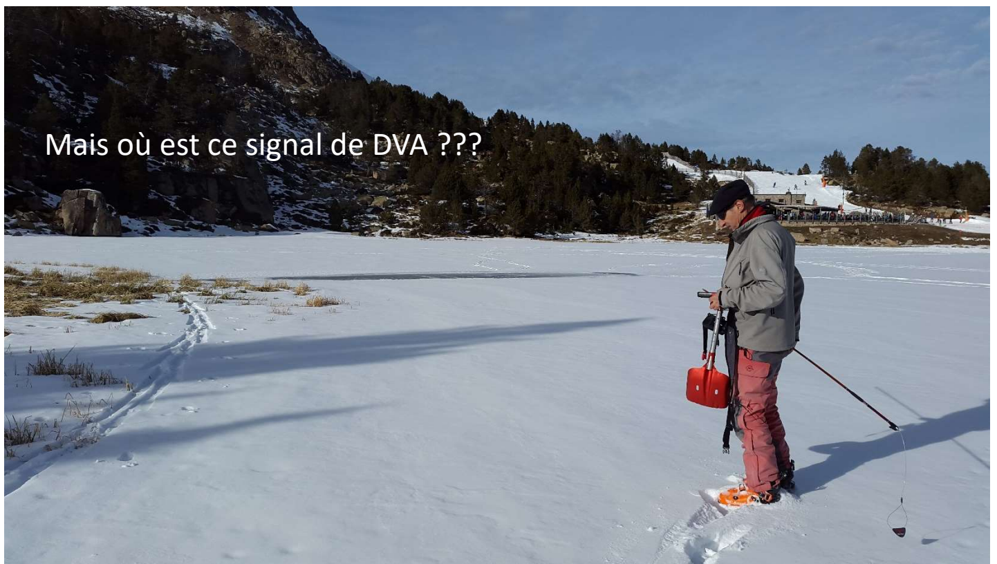
Recherches de DVA au lac des Pessons (bar, derrière moi à 150m)