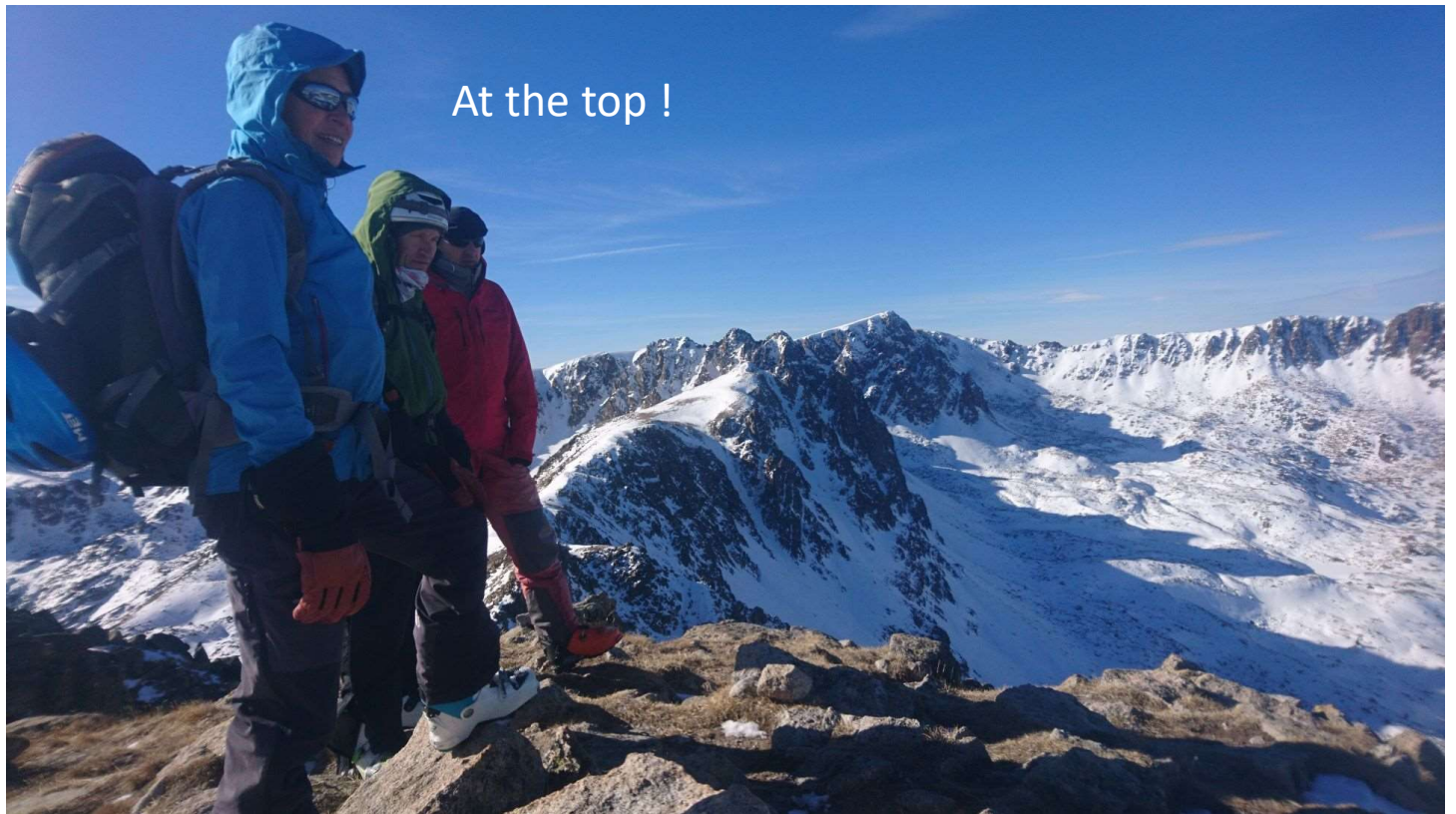
En arrière plan, le beau cirque des Pesson, belles ballade en perspectives